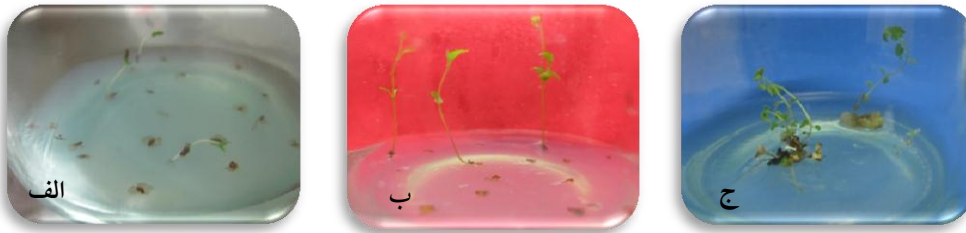
شکل ۲: مرحله رشد بذرهای توس در محیط کشت‌های پایه MS و B 5 با اعمال تیمار حرارتی: الف: شروع جوانه‌زنی بذرهای، ب: رشد و طول شدن ساقه‌ها، ج: تولید شاخسار و ریشه‌زایی آن‌ها

به ترتیب ۱۰/۳ و ۷ درصد و در گونه B. litwinowii در محیط کشت‌های MS و B 5 به ترتیب ۱۰ و ۴ درصد بوده است. گیاهچه‌های هر دو گونه از نظر رشد و نمو به‌طور کامل طبیعی بودند (شکل ۲).