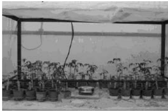
شکل ۲- محفظه طراحی شده برای آزمایش.

ارزیابی ارقام: با استفاده از یک میله فلزی سترون دو سوراخ به عمق ۲-۱ سانتی‌متری به فاصله یک سانتی‌متری در اطراف طوقه گیاه ایجاد گردیده و نصف سوسپانسیون لازم در هر یک از سوراخ‌ها وارد گردید و دهانه سوراخ‌ها با خاک پر شدند. این آزمایش به‌صورت فاکتوریل در قالب طرح پایه بلوک‌های کامل تصادفی در دو تیمار (دو عدد تخم یا لارو سن دوم به‌ازای هر گرم خاک و شاهد)، و در ۵ تکرار انجام گرفت و در نهایت گلدان‌ها در گلخانه‌ای با دمای 25 \pm 5 درجه سانتی‌گراد به‌مدت ۷ هفته قرار داده شدند (شکل ۲). تجزیه و تحلیل آماری توسط نرم‌افزارهای SAS و SPSS انجام شد.