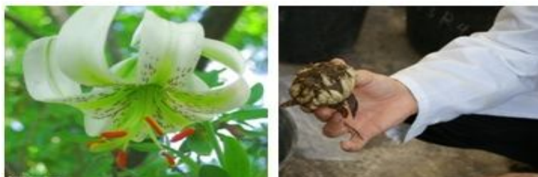
شکل ۱- سوخ و گل گیاه سوسن چلچراغ.

برگ، ساقه، گلبرگ و دمگل در کشت بافت خانواده سوسن‌سانان استفاده شده است (۱۸). این گیاه سوخ‌دار و سوخ‌های آن بدون پوشش است و بر خلاف سوخ خوراکی، دارای پوشش غشایی خشک نیست و بنابراین به شرایط نامساعد محیطی خارج از خاک و کمبود رطوبت حساس بوده و وجود این عوامل سبب از بین رفتن آن می‌شود. (۲۳). مطالعات محدودی در مورد غربالگری درون‌شیشه‌ای این گیاه نسبت به تنش‌های مختلف مانند امواج فراصوت (۴)، تنش شوری (۳۵) انجام شده است. استان اردبیل با ۲۹۲ میلی‌متر بارندگی سالانه به‌عنوان یکی از مناطق تحت پراکنش این گونه با ارزش با محدودیت جدی منابع آب مواجه است، به‌طوری‌که در سال ۱۳۹۳ در فروردین‌ماه فقط ۹/۳ میلی‌متر و در سال ۱۳۹۴ در خردادماه فقط ۷ میلی‌متر بارندگی داشته است (۳۳).