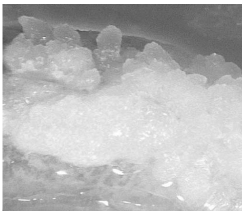
شکل ۳- کالوس‌زایی قطعات فلس گل سوسن در محیط کشت B دارای ۲ میلی‌گرم در لیتر 2,4-D.

تأثیر تنظیم‌کننده رشد بر کالوس‌زایی: نتایج به‌دست آمده از تجزیه واریانس داده‌ها نشان داد که 2,4-D در سطح احتمال ۵ درصد بر وزن تر کالوس تأثیر معنی‌داری داشته است. بررسی جدول مقایسه میانگین (شکل ۴) نیز نشان داد که با افزایش غلظت 2,4-D بر وزن تر کالوس نیز افزوده می‌شود. بیش‌ترین وزن کالوس در غلظت ۲ میلی‌گرم در لیتر 2,4-D به‌دست آمد (شکل ۳) در حالی که در محیط کشت بدون این هورمون هیچ‌گونه کالوس‌زایی رخ نداد. کالوس در هفته سوم و چهارم پس از کشت در قسمت‌های بریده شده بافت فلس‌ها شروع به تولید کرد کالوس‌های تولید شده تقریباً به رنگ زرد کم‌رنگ و روشن و از نوع کالوس‌های سخت بود طوری که موقع جداسازی برای توزین، کالوس‌ها به‌صورت یک توده منسجم بوده و به‌صورت یکپارچه از قسمت چسبیده به بافت فلس جدا می‌شد (شکل ۳).