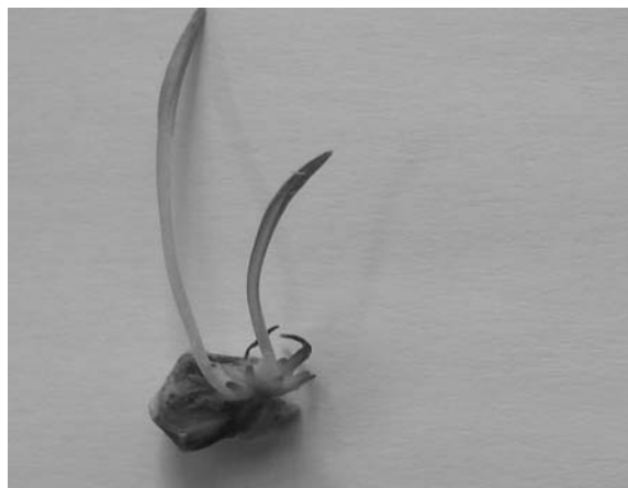
شکل ۱- پیازچه‌زایی از قطعات فلس گل سوسن در محیط کشت B دارای ۲ میلی‌گرم در لیتر IAA.

تأثیر تنظیم‌کننده‌های رشد بر پیازچه‌زایی: با توجه نتایج به‌دست آمده از تجزیه واریانس داده‌ها اثر هورمون ایندول استیک اسید بر تعداد پیازچه معنی‌دار نبود ولی با افزایش آن تعداد پیازچه به کمی افزایش پیدا کرد و بیش‌ترین تعداد پیازچه از تیمار IAA با غلظت ۲ میلی‌گرم در لیتر به‌دست آمد همچنین نتایج به‌دست آمده از تجزیه واریانس داده‌ها نشان داد که اثر متقابل 2,4-D و IAA در سطح احتمال ۱ درصد معنی‌دار است به‌طوری بیش‌ترین تعداد پیازچه در محیط کشت ۲ میلی‌گرم در لیتر IAA و بدون 2,4-D به‌دست آمد در حالی که در محیط کشت دارای ۰/۵ میلی‌گرم در لیتر IAA و ۲ میلی‌گرم در لیتر 2,4-D هیچ پیازچه‌ای تولید نشد (شکل ۱).