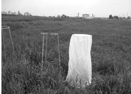
شکل ۱- قفس‌های فلزی مورد استفاده در مطالعه زیست‌شناسی سوسک برگ‌خوار غلات، در مزارع گندم منطقه گرگان.