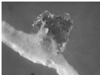
شکل ۱- توده تخم منفرد.